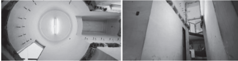
Imagen 4. Cielorraso de la rotonda, perspectiva recordada, “testigos” dejados en las losas y aberturas correspondientes al entrepiso demolido. Perspectiva de la sala “testigo” de las modificaciones. Mural preservado.