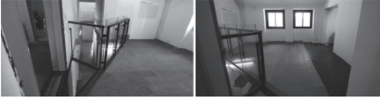
Imagen 3. Sala “testigo” de las modificaciones. Piso vidriado que permite recomponer la banderola desde favela . A la derecha sala de Archivo Audiovisual acondicionada. Placa de yeso que cierra la perspectiva vertical de la sala de torturas. Espacio de conexión de favela con la Sala de la escalera.