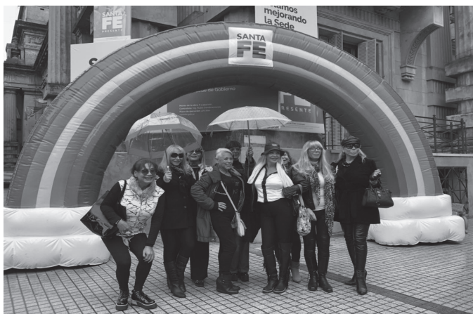
Mujeres trans frente a la Sede de Gobierno en Rosario, luego del acto oficial.

El jueves 17 de mayo de 2018, en el Día Internacional de Lucha contra la Discriminación por Orientación Sexual e Identidad de Género, un enorme arcoiris inflable se distinguía llamativamente en el frente de la sede del gobierno de la provincia de Santa Fe, en la ciudad de Rosario, sobre la vereda de calle Dorrego. Su presencia se explicaba porque, en una de sus oficinas, el entonces gobernador Miguel Lifschitz (2015-2019) entregaba a un grupo de veinte mujeres trans que habían sufrido graves violencias estatales durante la última dictadura (“Lifschitz entregó el primer reconocimiento de reparación histórica a una mujer trans sobreviviente de la última dictadura”, Diario Uno de Santa Fe , 17/05/2018) una resolución que disponía el otorgamiento de la pensión contemplada en la Ley provincial N° 13.298. Con este acto oficial, el gobierno de la provincia de Santa Fe se convertía en el primero en otorgar este beneficio a mujeres trans en América Latina.