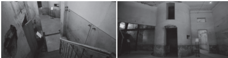
Imagen 5. Acceso al sótano desde el ex SI. Vidrios templados protegen las inscripciones. Piso de hormigón llaneado con “testigos perimetrales”, atriles con perfilera de hierro. Vista del panóptico, las columnas para apuntalamiento de la estructura, límites del piso de hormigón en la ex cocina, vidrios templados en las paredes resguardando inscripciones.