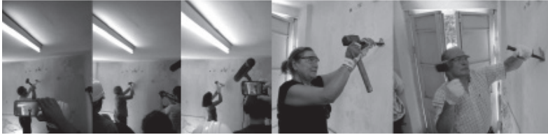
Imagen 1. Acción poética con participación de familiares y sobrevivientes en la demolición del vano que comunicaba con la sala de torturas. Ph: Alejandra Buzaglo, 2015.