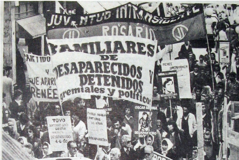
Un aspecto de la Marcha de la Resistencia, realizada ayer 01-10-1983

Un rato antes de comenzar, se pegaron siluetas con los nombres de personas desaparecidas por toda la zona donde iba a pasar la movilización y fueron pintadas paredes con las consignas: “No a la autoamnistía” “Aparición con vida” y “Libertad a los presos políticos”.