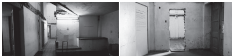
Imagen 2. Hall de ingreso al Espacio de Memoria. Pueden verse los “testigos” de las losas de entrepiso, los bancos y mostrador de cemento. Una placa de yeso removible cierra la ex sala de torturas. Vano abierto colectivamente. Cierre de la puerta con placa de yeso removible. Los textos son descripciones técnicas de la obra y fragmentos de testimonios de sobrevivientes seleccionados junto a antropólogas, psicólogas y abogadas.